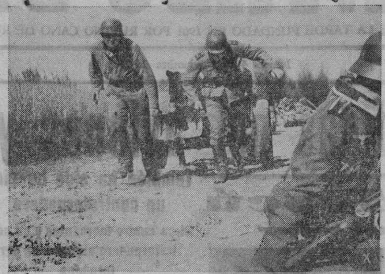
Una sección alemana de antitanques ocupa una posición ventajosa para rechazar el ataque de los carros rusos

Berlín, 3.—El diario berlinés 'Völkischer Beobachter' publica un artículo titulado 'Londres y la flota soviética del mar Negro', según el cual dicha flota se compone de un buque de línea antiguo, dos cruceros modernos y otro anticuado, 21 destructores modernos y seis antiguos, 50 submarinos y 50 lanchas rápidas. El diario pone de relieve que para poder ser utilizada dicha escuadra se necesitan unas instalaciones navales en tierra de gran importancia, instalaciones que la flota roja tenía establecidas en Nicolaiev, Odesa y Mariupol, ya en manos de los alemanes, además de los puertos de Sebastopol, directamente amenazados por el avance de las fuerzas del Reich, y los de Novorossik y Batum, en la zona caucásica, puertos estos últimos que no disponen de los diques necesarios, ni de las instalaciones precisas para atender al desenvolvimiento normal de los buques de que aun disponen los soviéticos en el mar Negro.