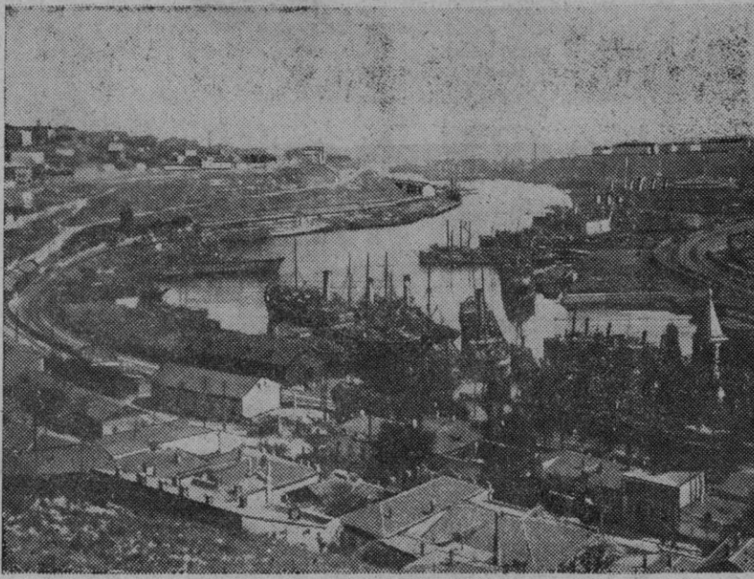
Una vista de la gran base naval soviética de Sebastopol, en Crimea, "estación" marítima entre el mar Negro y el mar de Azov