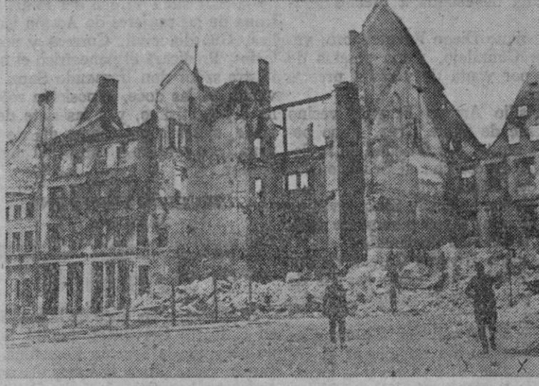
Estado en que dejaron las tropas rojas Riga después de su huida

«Ante Tobruk, en el curso de las operaciones locales, nuestras tropas capturaron algunos prisioneros. Las unidades aéreas del Eje efectuaron nuevas ofensivas contra la plaza de Tobruk y la zona de Marsa Matruk, y alcanzaron con numerosas bombas de diversos calibres las instalaciones portuarias, las baterías, los depósitos de material, las concentraciones de vehículos a motor, las líneas ferroviarias, los campamentos y los aeródromos. Se observaron incendios y explosiones. Los aviones ingleses lanzaron bombas sobre la ciudad de Benghasi y sus alrededores, causando daños materiales y ninguna víctima. En los frentes de Gondar, nada importante que señalar».—Efe.