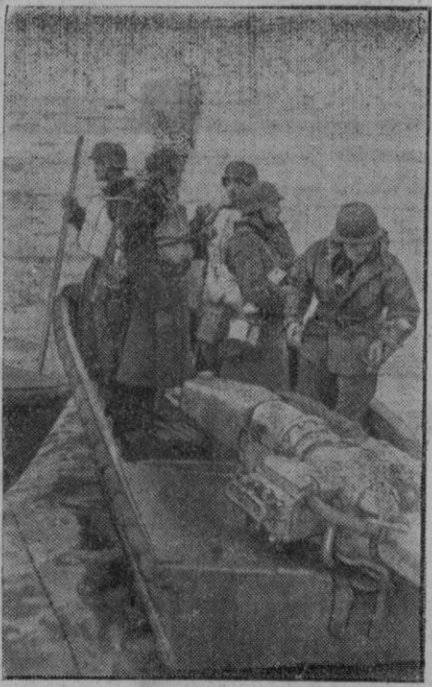
Fuerzas de choque alemanas montan en lanchas de asalto para tomar una isla del Báltico ocupada por los soviets.

New York, 9 (2 t.).—El mercader canadiense «Mondos», de 1.926 toneladas, se ha hundido a consecuencia de una explosión en los alrededores de las Islas Virgenes. El barcapitaneado por el capitán Paterson, de Ontario, cuya dirección ha prohibido por orden de la Marina inglesa comentar el hundimiento. Se desconocen las causas de la explosión.—Efe.