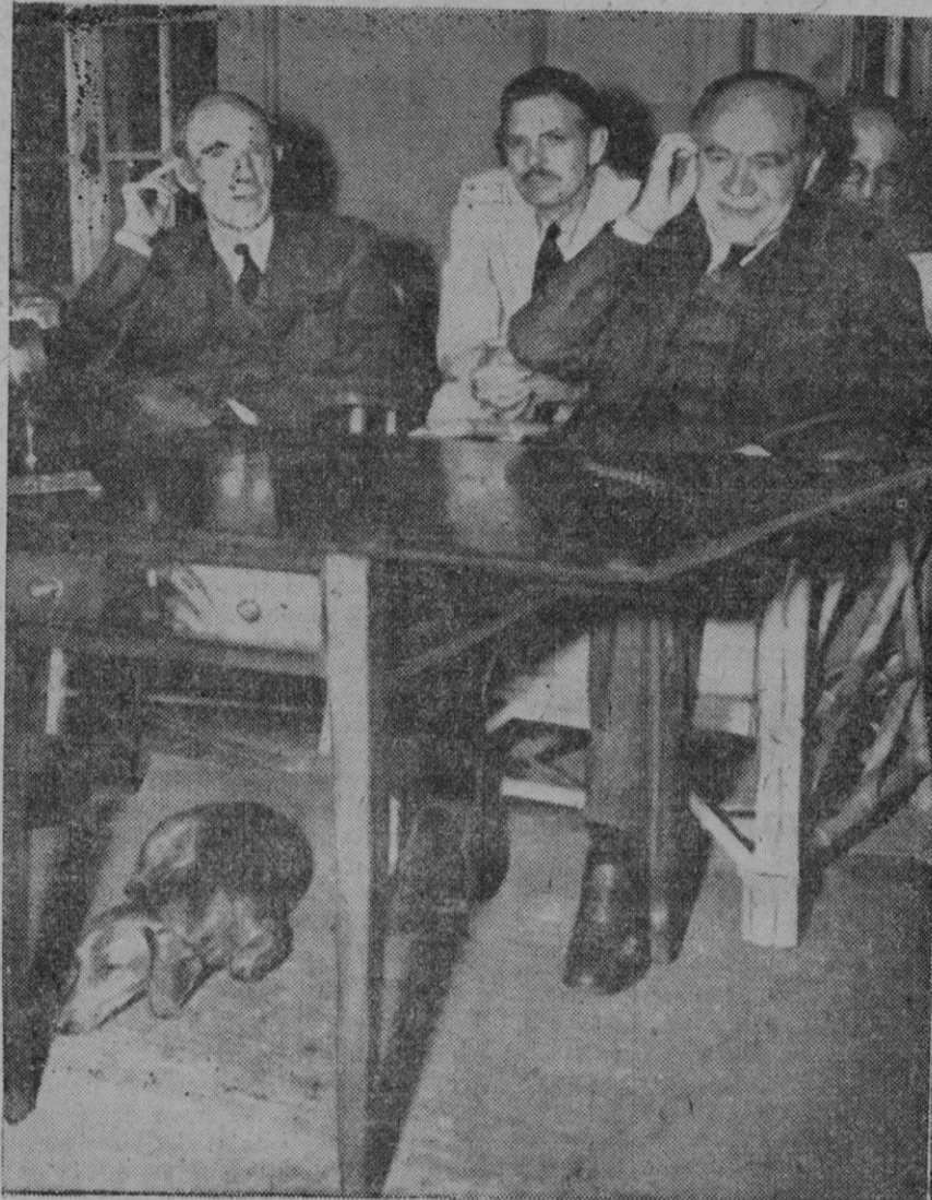
Interesantes declaraciones del doctor Dietrich

Gran Cuartel general del Führer, 9 (2 t.).—El alto mando de las fuerzas armadas alemanas comunica: «Las operaciones de profunda penetración en el centro del frente Este han conducido a otra gigantesca batalla de cerco. Tres Cuerpos de Ejército enemigos son atacados por la retaguardia por importantes fuerzas blindadas en el sector de Brians. Estos Ejércitos soviéticos no pueden esperar sino su destrucción. Con las formaciones que fueron cercadas de Wisma, el mariscal Timoschenko ha sacrificado en estos campos de batalla los últimos Cuerpos de Ejército que estaban en condiciones de combatir con plena eficacia en el conjunto del frente soviético.»—Efe.