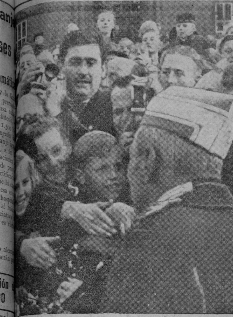
MONARCA POPULAR.—El Rey Cristián X, de Dinamarca, es un Monarca popular en su país. Sus frecuentes apariciones entre el público, como simple ciudadano más, dan lugar a espontáneas manifestaciones de simpatía de sus súbditos que, como en el momento que refleja la fotografía, hasta el (ahora con motivo de haber cumplido los setenta y un años), para testimoniarle su devoción y su cariño.

plazamiento de cuatro a seis mil toneladas, y escoltado por cinco destructores. El más grande de los barcos del convoy quedó incendiado y dando de banda. Otro barco resultó medio hundido, y fué abandonado por su tripulación. Otros dos barcos fueron alcanzados con bombas y quedaron detenidos y escorados. Los aviones británicos, termina el comunicado, no han sufrido bajas.—Efe.