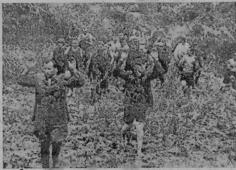
Grupo de soldados bolcheviques que defendían un fortín del cerco de San Petersburgo, se entregan a los alemanes

Berlin, 8 (6 t.).—Grandes incendios e importantes destrozos han sido causados en los objetivos militares de San Petersburgo por los miles de kilos de bombas arrojadas por la aviación alemana durante la pasada noche. Todos los ataques se efectuaron con excelente visibilidad y con gran arrojo por parte de los pilotos del Reich.—Efe.