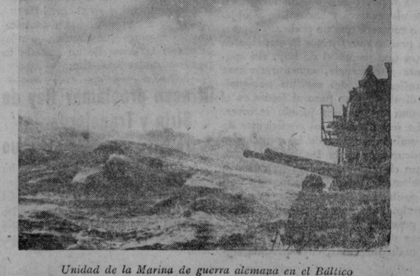
Unidad de la Marina de guerra alemana en el Báltico