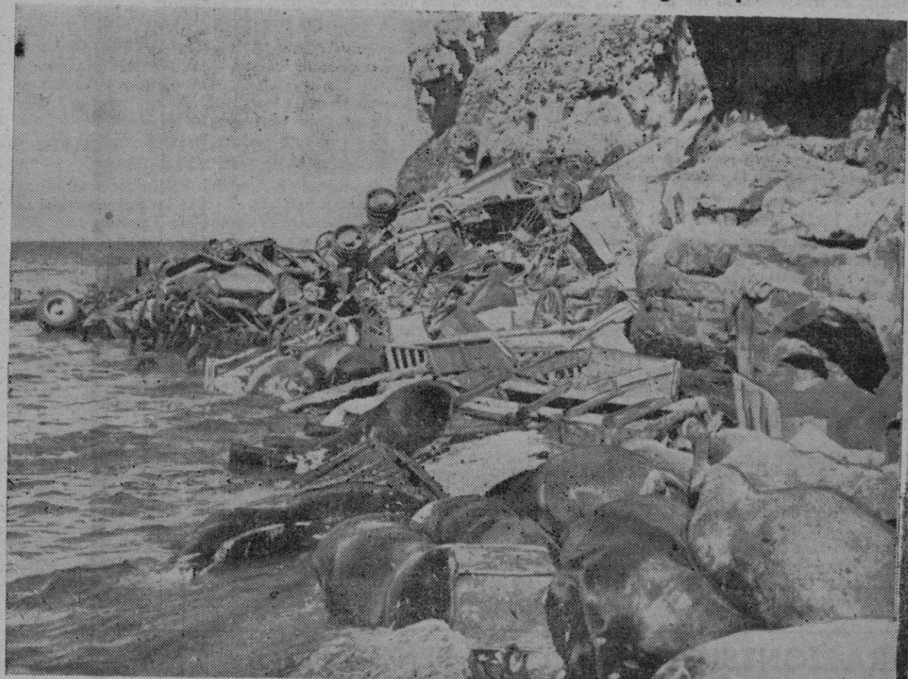
LA RETIRADA SOVIETICA.—Perseguidos por la aviación alemana, los bolcheviques sufrieron pérdidas enormes durante su retirada de los puestos estonianos del Báltico. En la fotografía aparecen los restos de un tren soviético, cargado de material de guerra y de ganado que, alcanzado por las bombas de la aviación, hizo explosión y cayó al mar desde una altura de cuarenta metros

Berlín, 6 (2 t.)—De fuente militar se informa que los bolcheviques han efectuado varios ataques contra las posiciones alemanas en el sector Norte del frente oriental. Todos estos ataques fueron rechazados con grandes pérdidas para los rusos que abandonaron sobre el campo de batalla varios tanques, entre ellos algunos de 52 toneladas, y numerosos muertos.