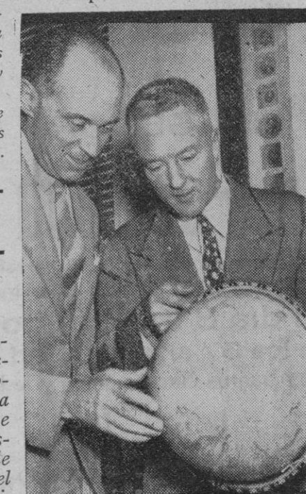
El almirante Byrd, que ha recibido autorización para hacer un nuevo viaje al Polo Sur, figurando al frente de una expedición de ciento sesenta personas, aparece en la foto mostrando al contralmirante Waesche la ruta que han de seguir