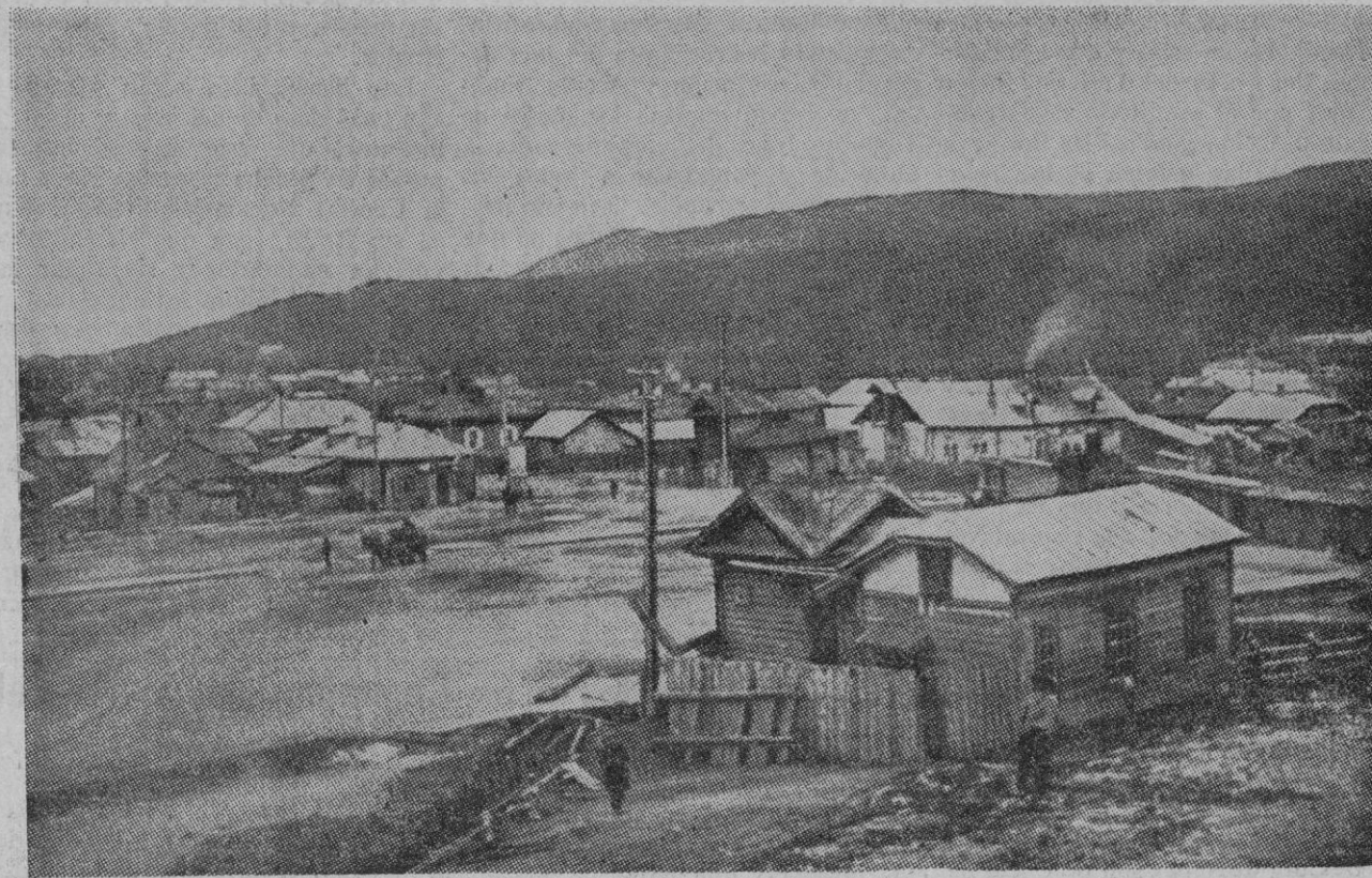
Alexandrovsk, capital de la zona rusa de la isla de Sakhalin