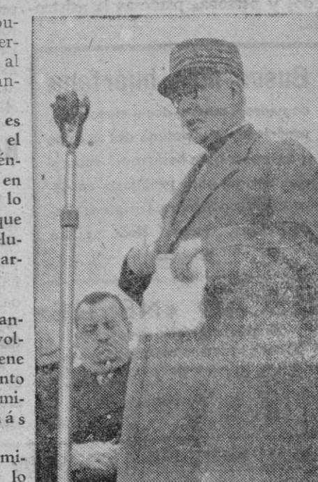
El embajador francés en España, mariscal Pétain

Tanto el general Yagüe como los oficiales que le acompañan han sacado las mejores impresiones de estas visitas.