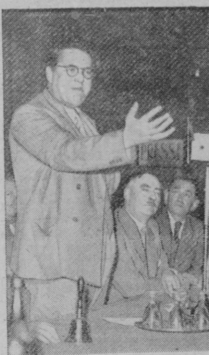
M. Doriot, jefe del Partido Popular Francés y valiente defensor en Francia de la Causa de Franco durante la guerra

en la vecina República y de la relación directa que existe entre los postulados que defiende y los que informan el nuevo Estado español.