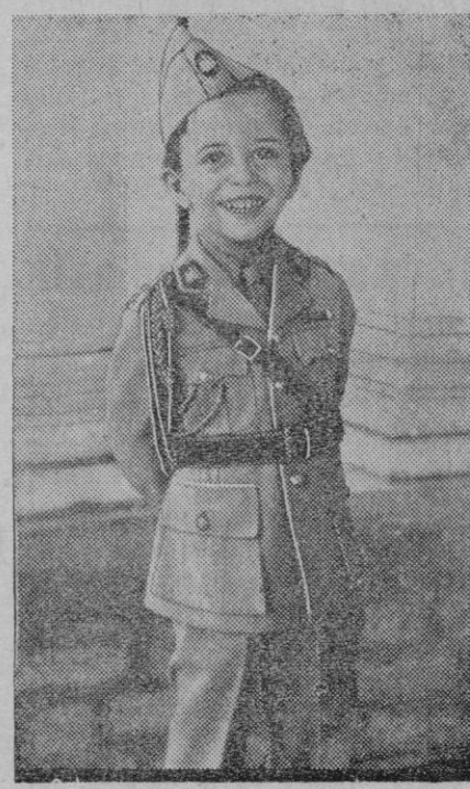
Inmediatamente de ocurrir la muerte del Rey Ghazi, su hijo ha sido proclamado sucesor con el nombre de Faisal II. En la fotografía aparece el pequeño Soberano, que no cuenta más que cuatro años de edad