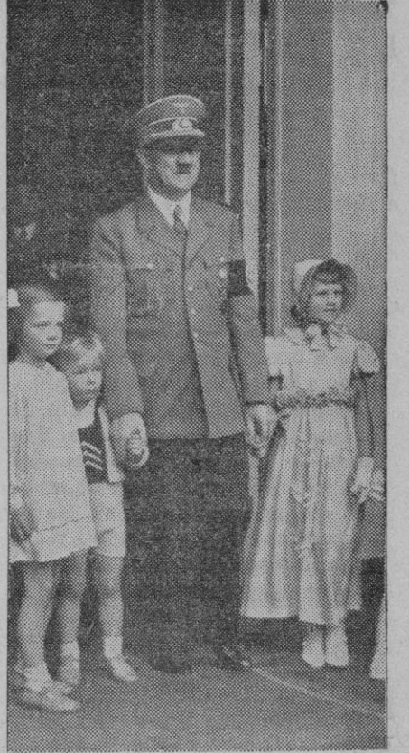
Adolfo Hitler, en el día de su cumpleaños, fotografiado con varios niños de los que acudieron a felicitarle

Actualmente se encuentran en diferentes puertos del Sur de España los buques de la escuadra alemana que salieron de puertos alemanes el día 25 de Abril para efectuar maniobras en el Mediterráneo. Desde los citados puertos del Mediodía zarparán para los del Norte, visitando primero El Ferrol, y luego la ría de Arosa, Pontevedra y Vigo, y por último marcharán a Portugal, anclando en la bahía de Lisboa. La fotografía presenta una división de la flota alemana navegando con rumbo a España.