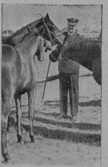
El almirante Horthy, Regente de Hungría que, según rumores, tiene la intención de hacerse proclamar Rey de Hungría. Aparece retratado en su célebre finca hípica en Kenderes, donde cría sus famosos caballos de silla

Una vez ocupado Somosierra y sin el más pequeño descanso, continuaron batiendo al enemigo, empujándolo hacia el Sur, a pesar de haber sido reforzado con lo mejor del Ejército rojo, enviado desde Madrid, y aumentada su aviación y artillería, en tanto que las fuerzas de la columna, lejos de decaer su moral ante el considerable refuerzo del enemigo, se elevó con las dificultades que le presentaron para el avance, consiguiendo nuevos triunfos en Robregordo y Piñuefcar, quebrantando y desmor-