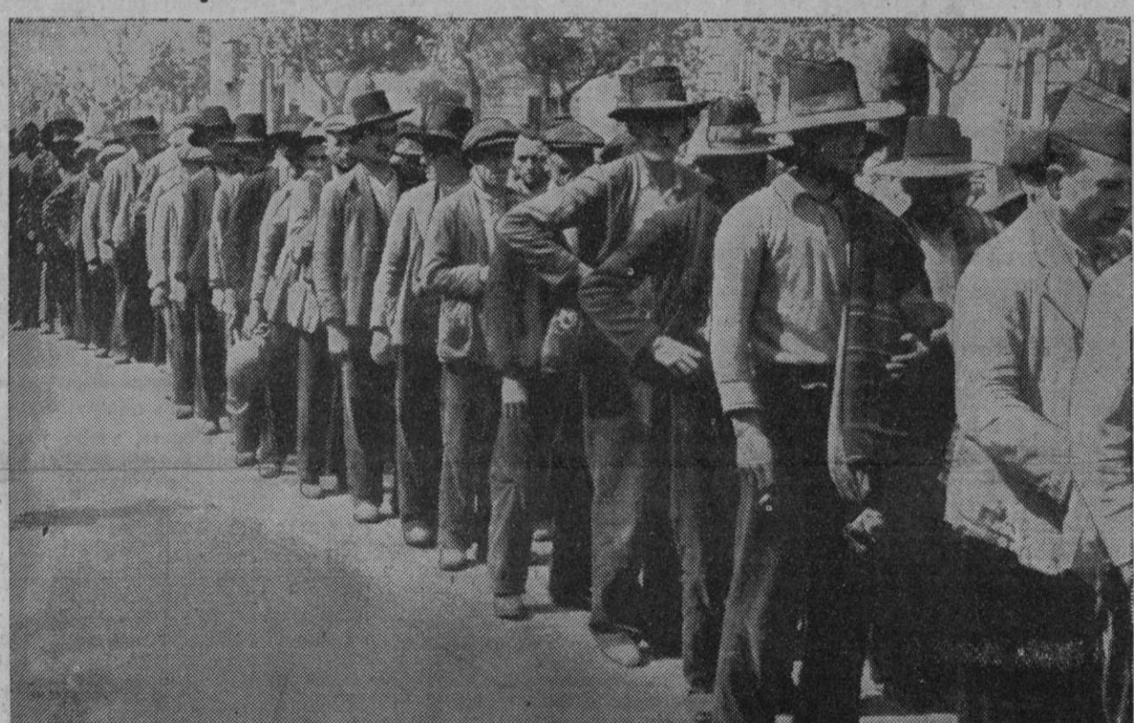
CARNE DE CANON.—Testimonio gráfico del reclutamiento forzoso en la zona roja. Campesinos de todas las edades son obligados a comparecer en las oficinas de reclutamiento para inscribirse como combatientes en las filas rojas

AUXILIO SOCIAL EN GUARDIA Llegan constantemente camiones de Auxilio Social de Navarra, de Bil-