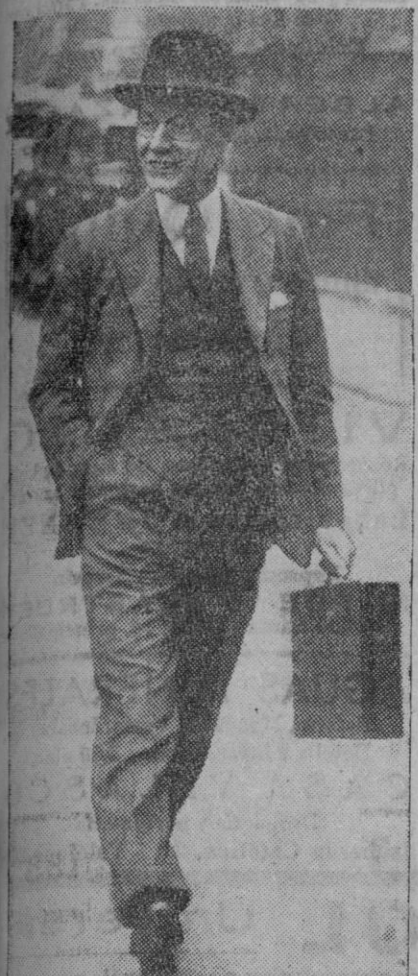
Malcolm Mac Donald, ministro de Colonias