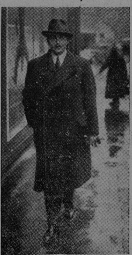
Por considerarle complicado en una conjura contra la nueva situación en Austria, el Gobierno de Viena ha decretado la detención del archiduque Otto de Habsburgo, cuyos bienes, que le fueron devueltos en 1935, han sido confiscados. En la fotografía aparece el archiduque paseando por una calle de París, donde actualmente se encuentra como exilado.