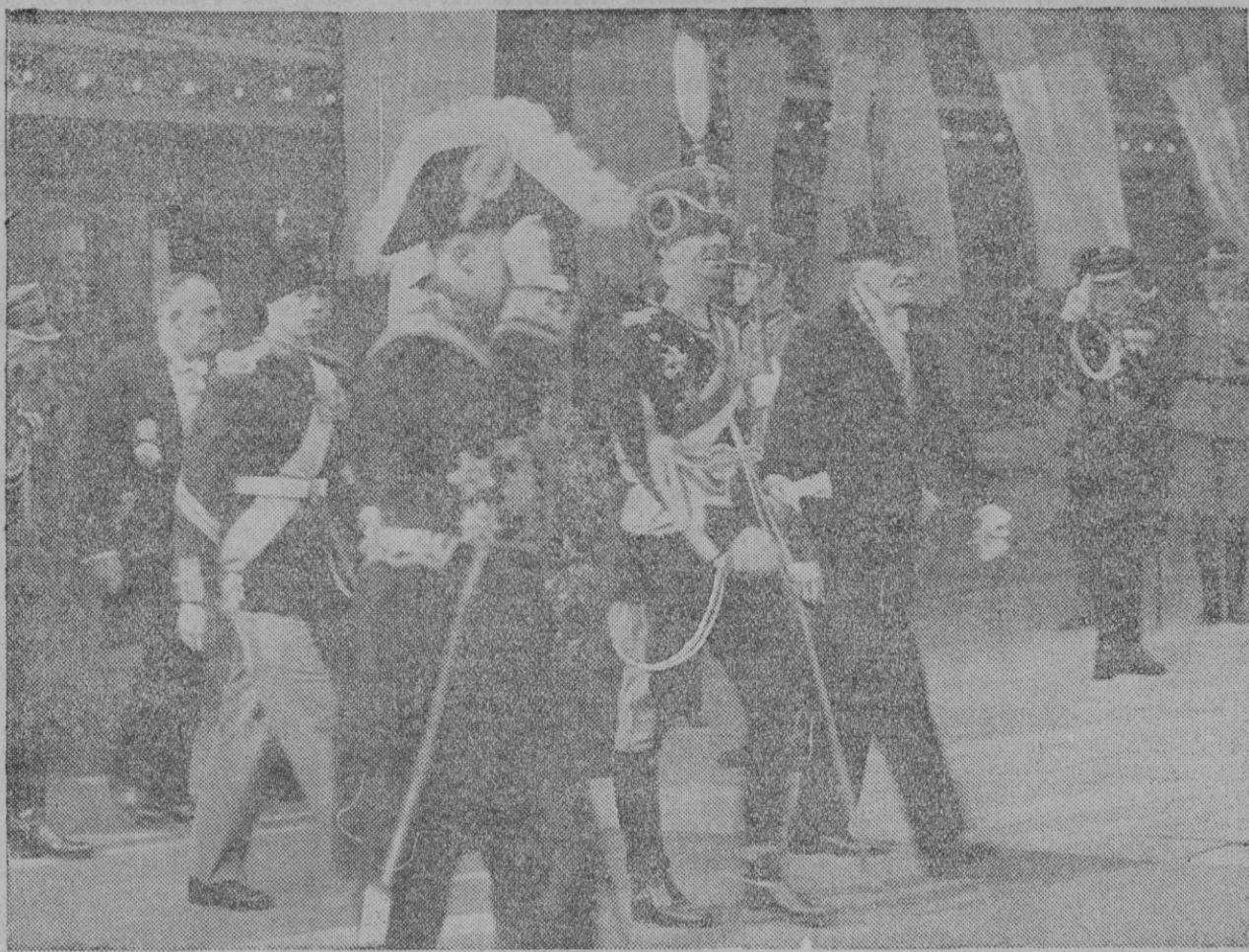
La presente fotografía, publicada hace algún tiempo en estas columnas, recobra actualidad con ocasión de la buena disposición en que Polonia y Rumania se hallan para reconocer al Gobierno del Generalísimo Franco. El Rey Carol, durante su visita a Praga. A su izquierda, el presidente polaco señor Moscicki, y detrás, el príncipe Miguel, heredero del Trono de Rumania y el señor Antonescu, ministro de Negocios Extranjeros de Polonia.

El texto es impresionante. Los sufrimientos de Madrid no los conmueven.