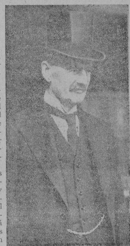
Mr. Chamberlain, primer ministro inglés, que viene realizando una política de franca aproximación a Italia y que puede extenderse al eje Roma-Berlin

El mismo periódico afirma que hay informaciones que aseguran que el Gobierno inglés se prepara para entrar en conversaciones, a cuyo efecto marchará a Roma una destacada personalidad del Foreign Office, según se ha anunciado ya extraoficialmente. Se afirma asimismo que las negociaciones por parte de la Gran Bretaña se entablarán a base de que