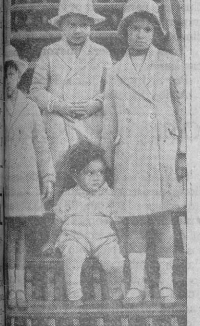
Los muchos exóticos huéspedes de estos días se dirigen a Inglaterra para presenciar las festividades de la coronación, se encuentran el maharaja y sus cuatro hijos. Aquí se ve a niños a bordo del buque en el momento de llegar a Inglaterra.