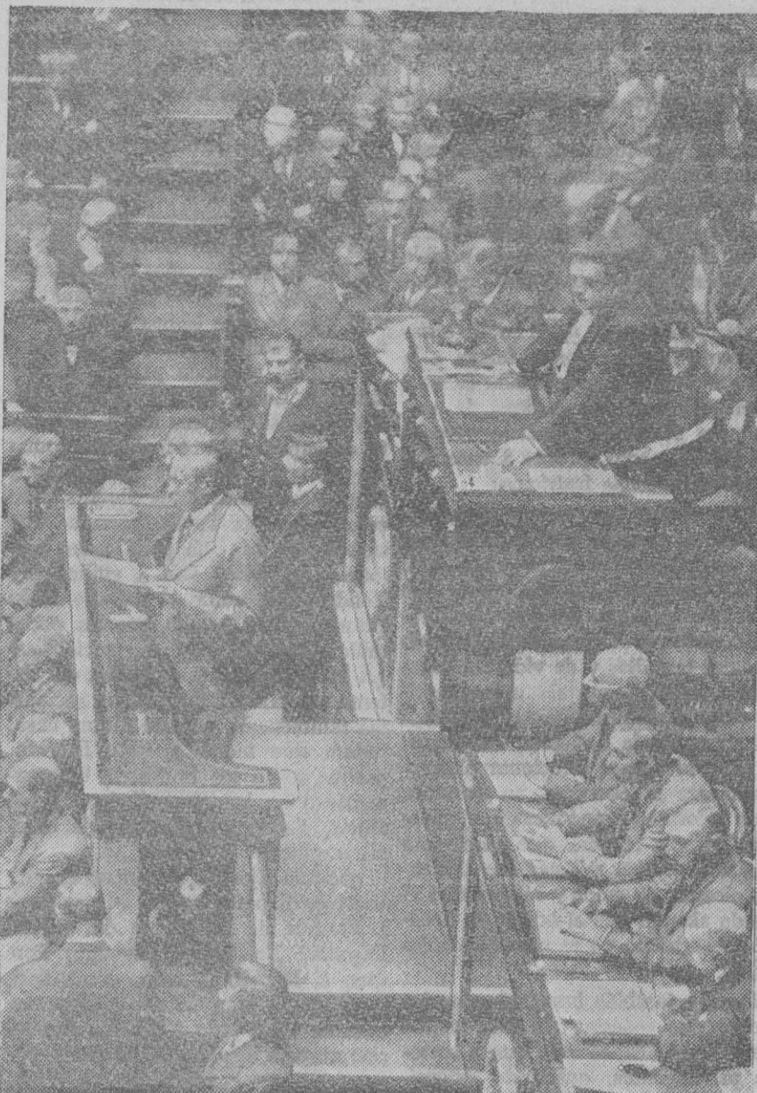
Léon Blum, el jefe que preside el Gobierno francés, y máximo enemigo de la España nacionalista, leyendo en la tribuna de la Cámara su discurso acerca de la desastrosa situación financiera a que ha llegado Francia a consecuencia de la desastrosa política del Frente Popular. En la mesa presidencial, en la parte superior de la fotografía, Herriot, presidente de la Cámara