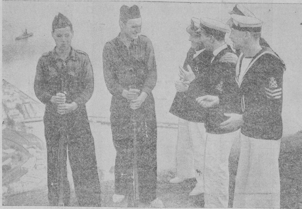
Varios oficiales y soldados de un buque de guerra británico que se encuentra en las islas Canarias tratan de hacerse entender, por señas, por dos falangistas que prestan servicio de vigilancia en la costa. Como puede apreciarse, todos se muestran encantados de la conversación que no entienden. Constituyen una especie de Sociedad de Naciones