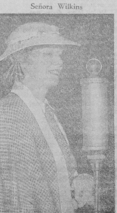
En la nueva expedición de submarinos al Polo Norte, que va a emprender el explorador polar Hubert Wilkins, participará su esposa. Esta, que ha sido actriz, vuelve a su profesión con objeto de obtener fondos para sufragar los gastos de la expedición

Es por esto por lo que en el mitin de referencia se ha trocado en un acto de protesta de unos negociantes torpedeados. Concurrió mucho público. El primer orador reveló que los huesos de las aceitunas están ya muy gastados. Fueron desfilando oradores que hacían manifestaciones análogas a las