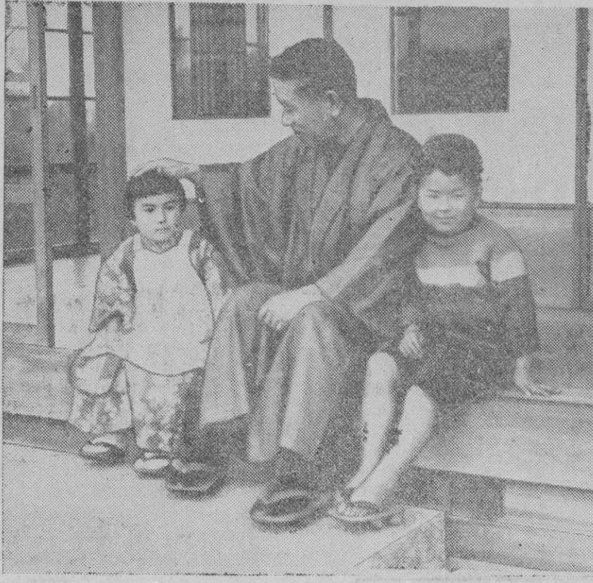
El primer ministro japonés, Hirota, que acaba de dimitir, fotografiado con sus sobrinos delante de su hotel en Kugenuma

«EL ESTADO ORGANIZARA LA JUSTA Y PROGRESIVA DISTRIBUCION DE LAS CONTRIBUCIONES E IMPUESTOS EVITANDO EL ANIQUILAMIENTO DE LA RIQUEZA CREADA, Y LOGRARA EL REPARTO DE LAS CARGAS SOBRE QUIENES DEBAN SOPORTARLAS.»