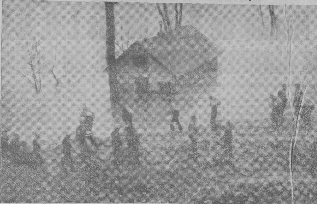
Las inundaciones en los Estados Unidos por las lluvias torrenciales, que han determinado el desbordamiento de los ríos, han causado enormes estragos, especialmente en la región de Ohio. La fotografía representa los primeros trabajos de construcción de un dique provisional para contener y desviar las enormes corrientes

Nueva York, 27.—El número de víctimas causadas por las inundaciones al desbordarse los ríos Ohio y Missisipi, aumentan incansablemente.