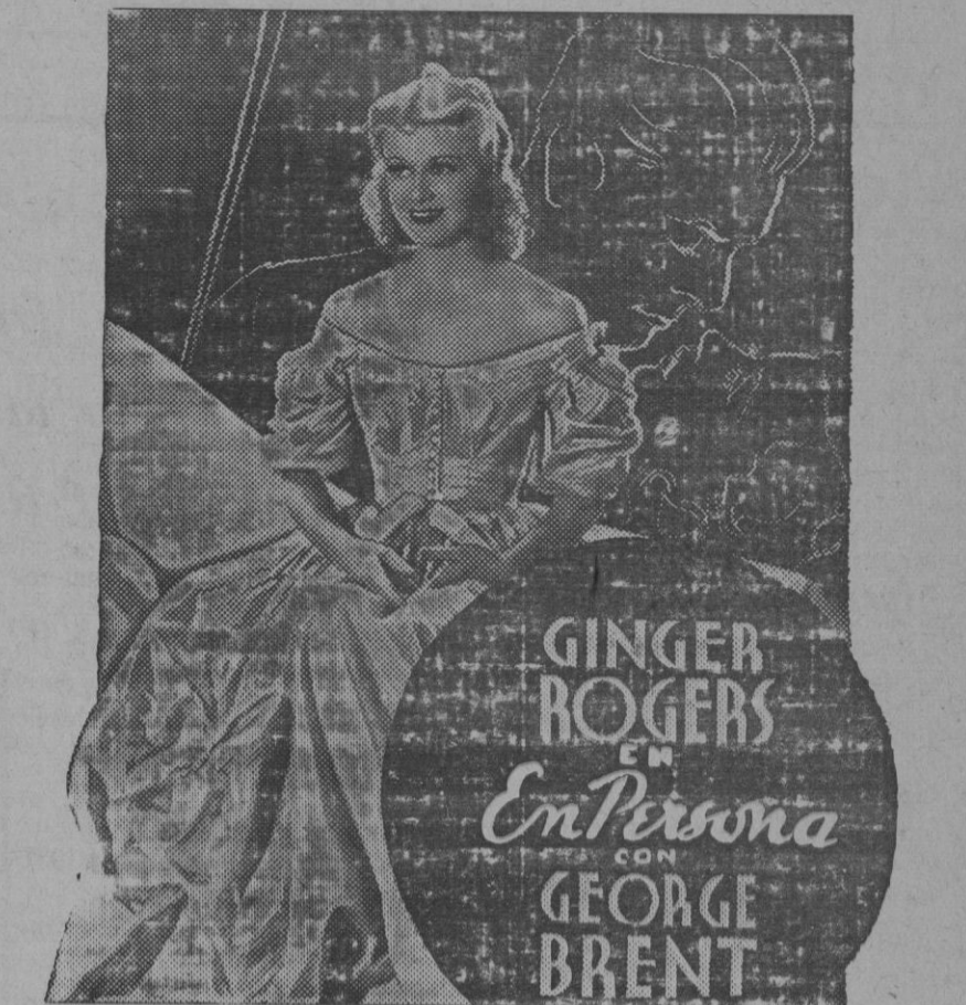
Un film RADIO... Naturalmente!

«NO ME DIGAS QUE ME QUIERES» «LEJOS DE MI VIDA» «LEJOS DE MI CORAZON» «EN VIDA ME PERTENECE»