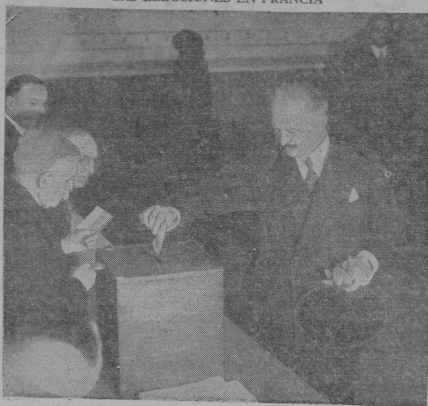
El Presidente de la República, Mr. Lebrón, depositando su voto