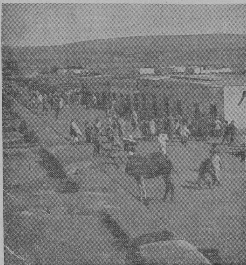
Calles principales de la ciudad de Jijiga, destruida por los aviones italianos. En primer término, el cuartel general del ras Nassibu comandante en jefe de los ejércitos del Sur

La ilegalidad de la medida adquiere mayor relieve si se tiene en cuenta el gran número de Ayuntamientos que fueron elegidos en Abril de 1933 y que lógicamente no han llegado al término de su mandato. Desde este punto de vista, el Decreto de convocatoria adolece de un vicio fundamental de nulidad que invalida en derecho la consulta electoral que se acerca. Por si esto fuera poco, no hay que olvidar que la situación so-