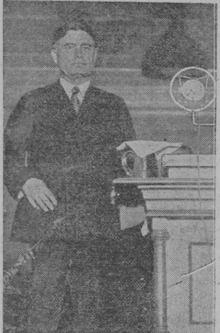
El conocido político americano, senador Borah, es actualmente el que tiene mayores posibilidades de ser candidato adversario republicano de Roosevelt en la elección de presidente

dió los registros a la casa del alcalde, en la que halló tres pistolas Star y una automática, para las que no tenía licencia, y procedió a detener al alcalde, el cual ha ingresado en la cárcel de Arenas. El hecho es muy comentado.