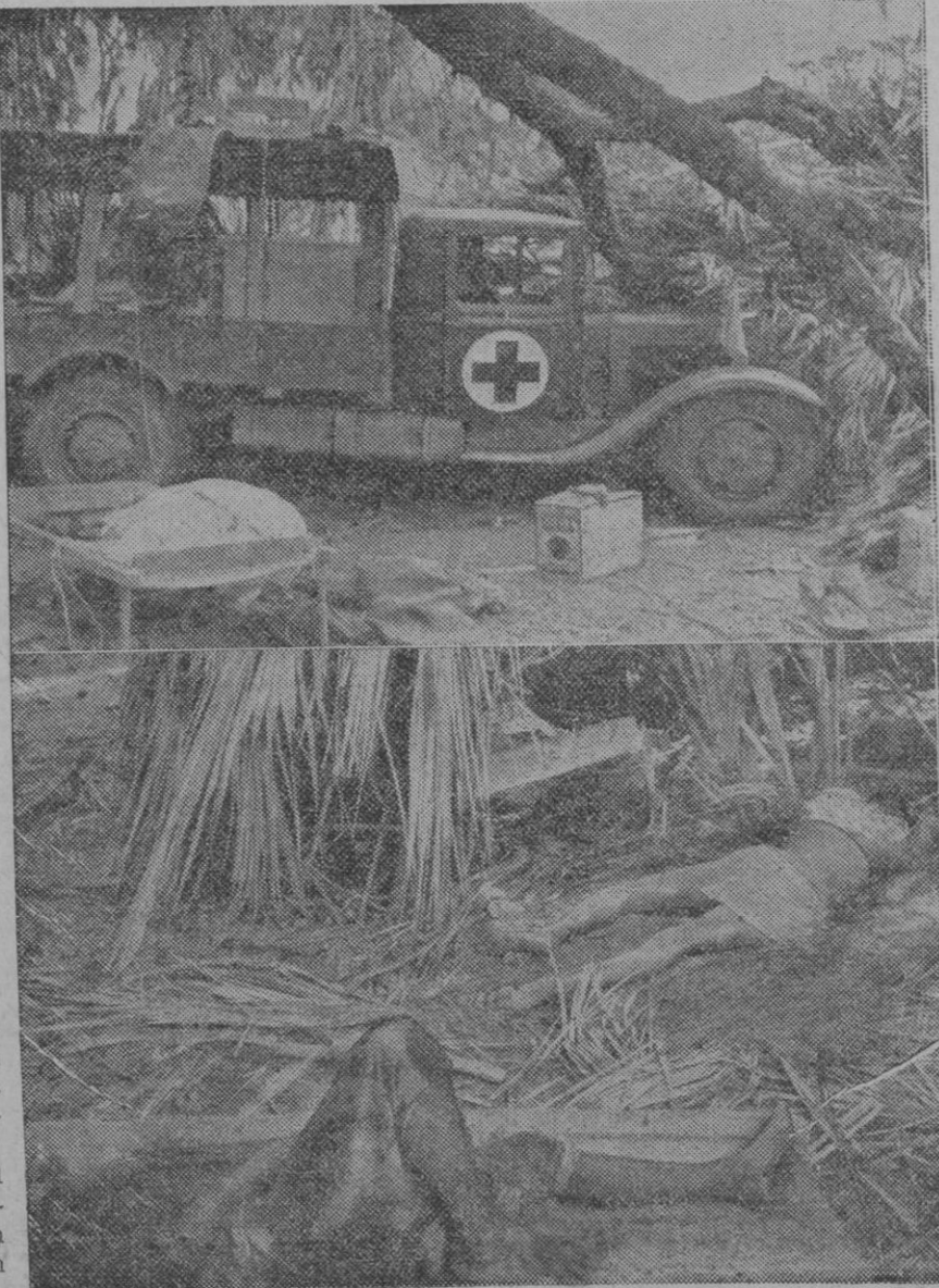
He aquí dos ilustraciones de la ambulancia sueca de la Cruz Roja, después del bombardeo de los aviadores italianos cerca de Dolo. En lo alto, uno de los coches debajo de un árbol tronchado por las bombas, y en la parte baja dos indígenas muertos

MUTUALIDAD INDUSTRIAL Y MERCANTIL DE SEGOVIA Y SU PROVINCIA Domicilio social: Juan Bravo, 24, pral. Teléfono 268 ¡PATRONOS SEGOVIANOS! Al asegurar los riesgos de accidentes del trabajo o al terminar vuestros contratos de este seguro consultad nuestra organización y tarifas Jamás tendréis litigios con motivo del pago de los siniestros y las incidencias que surjan de los contratos se resolverán siempre en Segovia en vuestra presencia, por patronos segovianos y en la casa de esta Mutualidad que es la de todos los patronos de la provincia