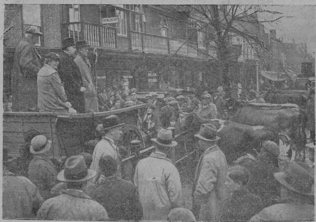
He aquí un aspecto de la campaña electoral en Inglaterra, cuyas elecciones se habrán verificado hoy. En esta fotografía se ve al famoso hombre público, Mr. Winston Churchill, pronunciando un discurso delante de numerosos trabajadores y dentro de una carreta en marcha hacia Epping.

Cooperativa de compras de Cantimpalos La Cooperativa de fabricantes de embutidos de Cantimpalos compra carne de cerdo todos los días laborables, y garantiza el peso