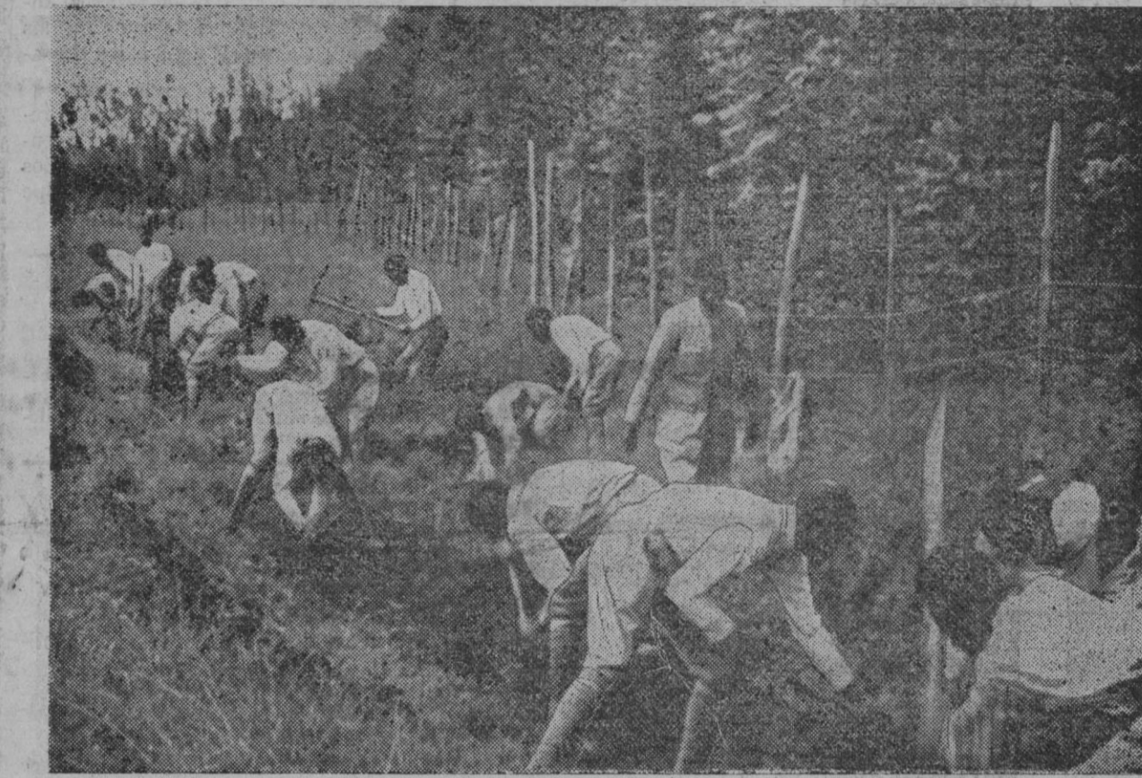
Soldados abisinios cavando trincheras detrás de un cercado de madera y alambre y cuyos trabajos forman parte de los preparativos de defensa de su país

«Es presumible que comprendiendo así, la incidencia planteada ayer en el Consejo por el ministro de Marina, quede resuelta en la conferencia, trascendental, que hoy celebrarán los señores Lerroux