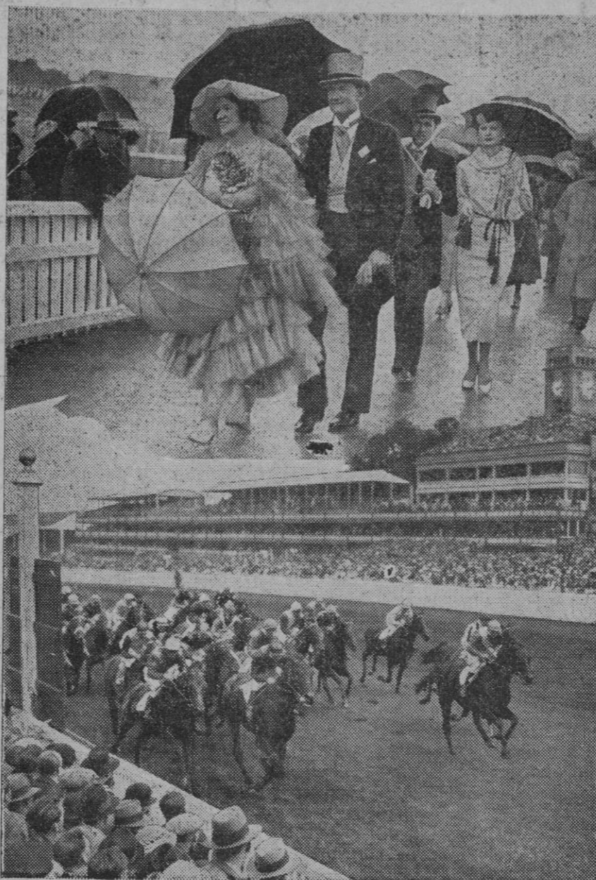
Algunas ilustraciones de apertura de la estación de carreras en Ascot, Inglaterra, que han tenido lugar en presencia de la reina Mary, del príncipe de Gales y de los duques de York y de Kent. Abajo una vista general de la carrera, y en lo alto se ve la elegancia tradicional de los tocados que se destacan entre la lluvia

Después de la lectura del apuntamiento, el fiscal calificó los hechos del delito de auxilio a la rebelión, del cual son responsables todos los procesados, para quienes pidió quince años de reclusión.