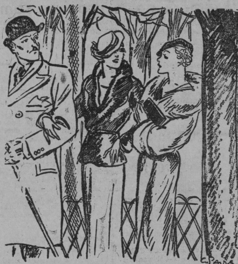
—Perdona que no asistiera a tu boda, pero estaba fuera de París... —No te apures; otra vez será.