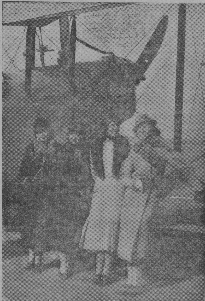
En la playa de la Victoria, de Cádiz, se están llevando a cabo diversos vuelos feministas, en los que la mujer demuestra una gran pericia y que siempre está a gran altura...

Para el hijo del señor Prince es indudable que su padre ha sido asesinado para impedir que hablara en la Comisión de encuesta. Recuerda ha-