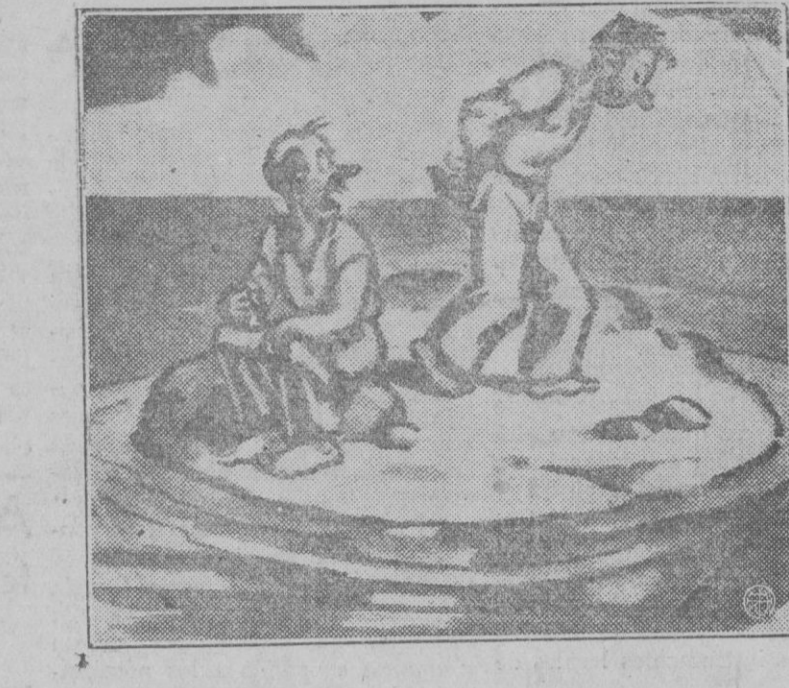
EL MEDICO (A SU COMPAÑERO DE NAUFRAGIO).—Eso se le quita a usted dándose grandes paseos.

—Se refiere usted a la Firpe. Nunca segundas partes fueron buenas,