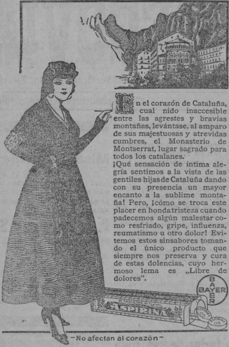
—No afectan al corazón—

En el corazón de Cataluña, cual nido inaccesible entre las agrestes y bravas montañas, levántase, al amparo de sus majestuosas y atrevidas cumbres, el Monasterio de Montserrat, lugar sagrado para todos los catalanes.