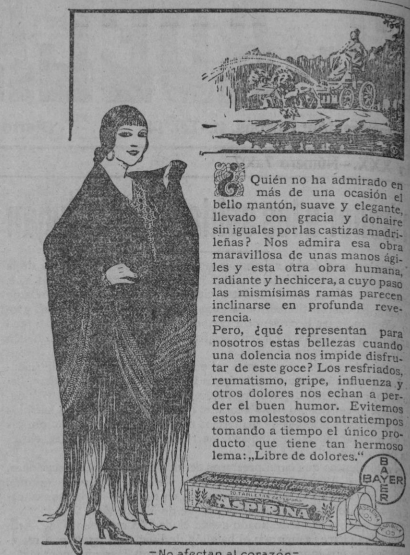
—No afectan al corazón—

Se llevará en ésta las imágenes del Niño Jesús y de la Niña María, dirigiéndose por el camino más corto al santuario de Nuestra amadísima Patrona la Virgen de la Fuencisla, ante cuya Imagen se hará la consagración de todos los niños a Jesucristo y a su Santísima Madre y se cantará la salve popular.