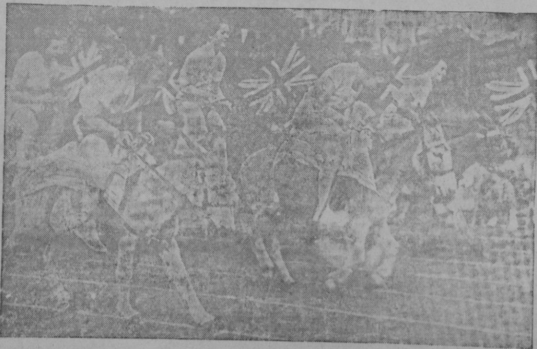
Original y tradicional carrera. La sonrisa de las amazonas y su simpática prestancia revelan el éxito de cada año mayor de la carrera.