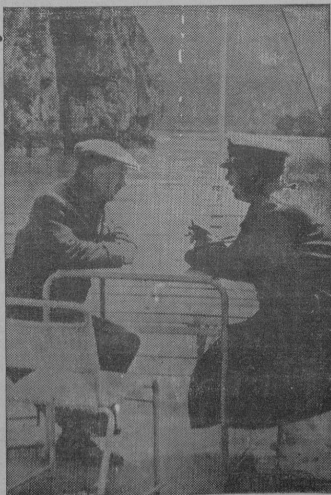
A bordo de un vapor bajando por el Danubio, el Rey Carol de Rumania ha sostenido una importante conferencia con el Sr. Edduardo Benes, Presidente de la República Checoslovaca.