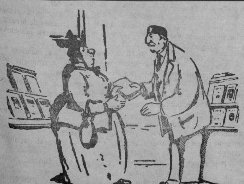
—De modo que este libro me resultará interesante? —¡Oh! Puede usted leerlo con los ojos cerrados.

El día 20, domingo tercero del mes, tendrán sus cultos mensuales a Nuestra Señora del Perpetuo Socorro, los archicofrades.