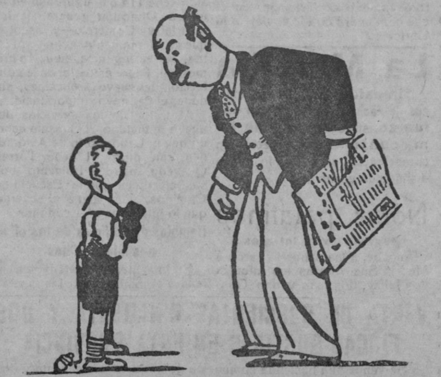
—¿Cómo las personas menores no contestan a las mayores? —¡Ah!, sí. ¿Y por qué mamá, que es más pequeña que tú, te contesta y te aguantas?