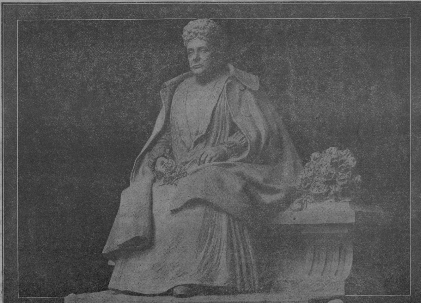
Estatua de S. A. R. la infanta doña Isabel Francisca de Borbón, ayer inaugurada en el Real Sitio de San Ildefonso