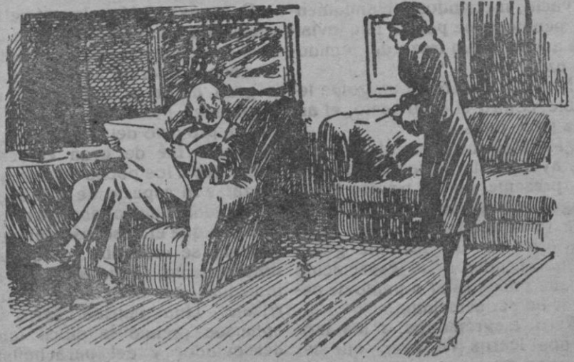
La hija.—Dime, papá. ¿Has leído el libro que te he regalado? El padre.—No, hijita; lo está leyendo tu mamá, para ver si yo puedo leerlo.