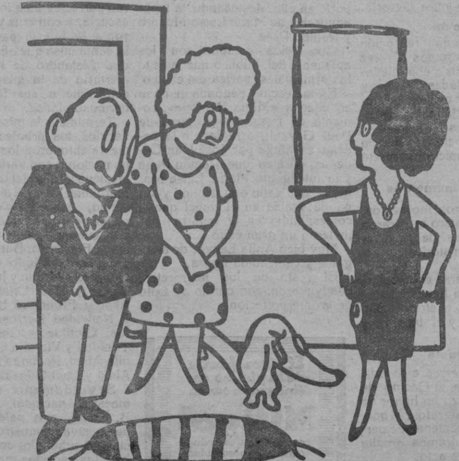
El padre.—No es que me oponga a tu casamiento, pero comprenderás hija mía, que casarte con un maestro, no es precisamente un gran porvenir. La niña.—Pero papá, es que es un maestro del charlestón.

Nada más consolador que contemplar las notas que se nos envían de los pueblos castellanos sobre la celebración de la «fiesta del Arbol».