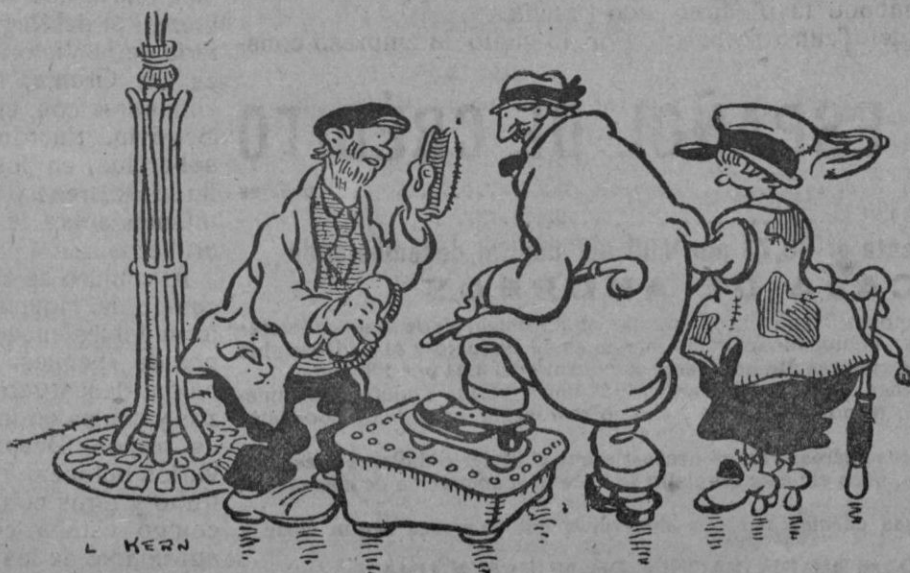
—Cuando termine de limpiar las botas al señor, ¿puedo también limpiar el abrigo de cuero de la señora?