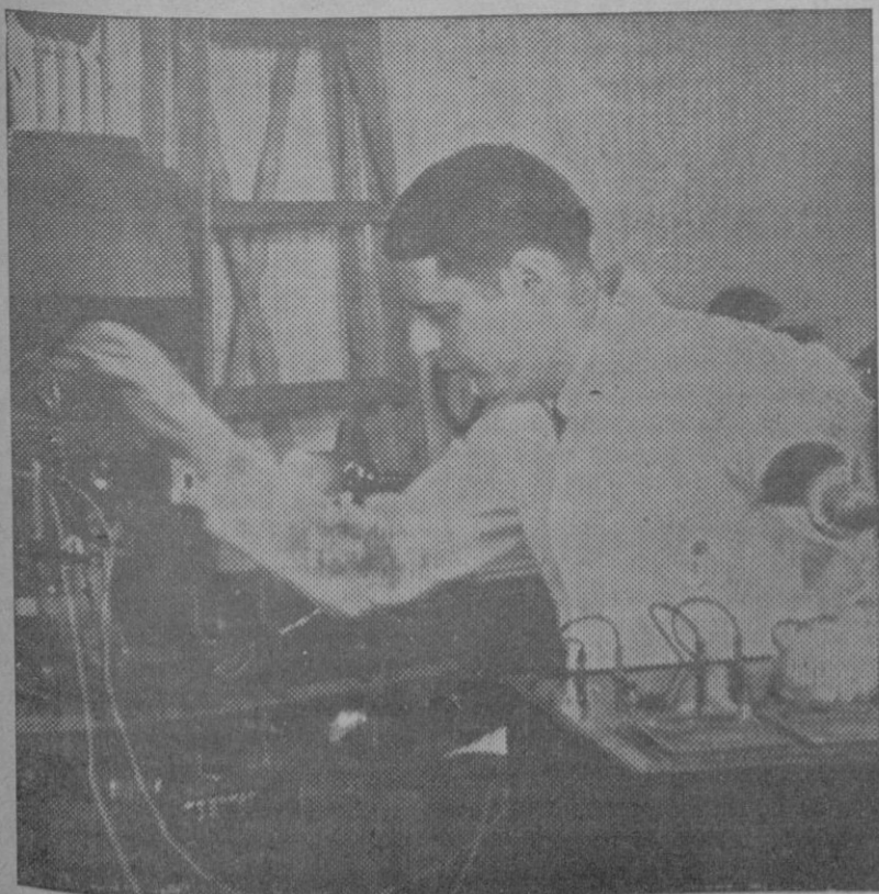
En Chicago un Ingeniero acaba de inventar un misterioso «ojo» eléctrico el cual es capaz de destruir aviones, autos, vapores, etc... aún a larga distancia por mediación de las ondas de la radio