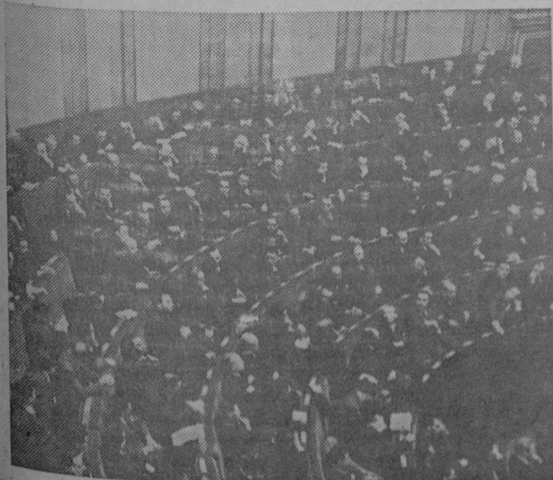
Aspecto que ofrecía el Congreso, durante la sesión en la cual se aprobó la dimisión del Presidente de la República Señor Alcalá Zamora.