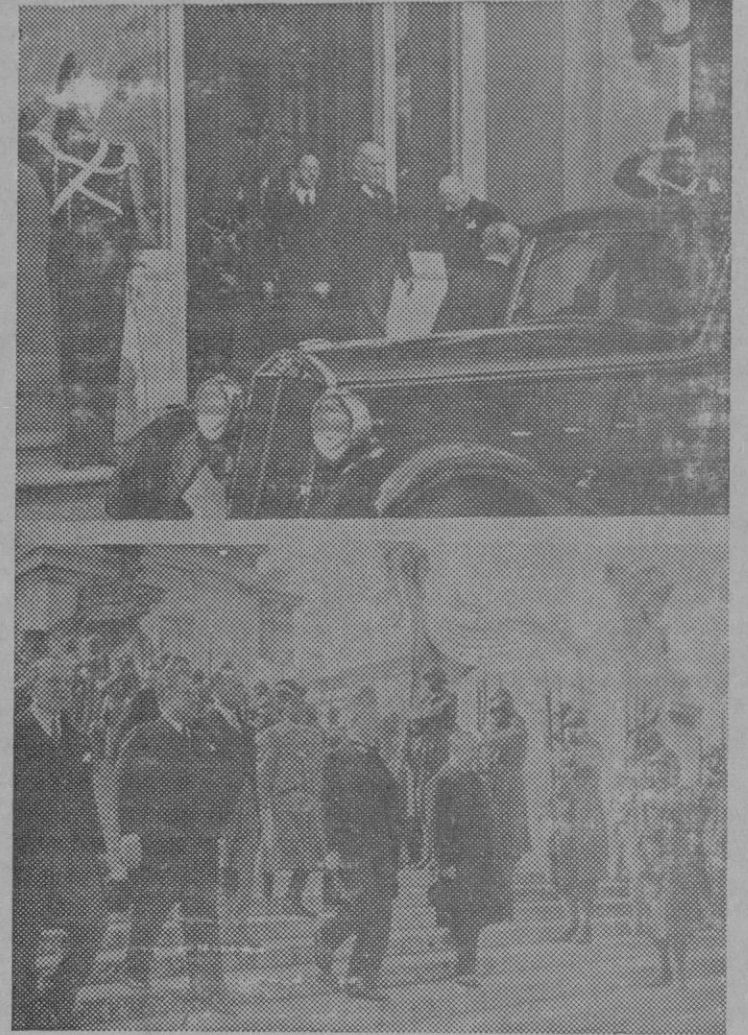
Los ministros austriacos y húngaros se han trasladado a Roma.

A roche reanudó solemnemente sus tareas el Parlamento catalán, pronunciando el señor Companys un discurso diciendo se propone realizar labor positiva de paz y orden.