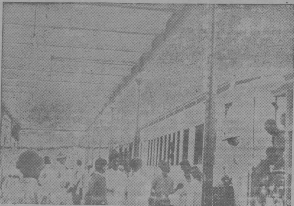
La ciudad de Djibuti, situada en el Golfo de Aden, es el lugar donde principia la línea ferroviaria que une el golfo de Aden a Addis-Abeba.