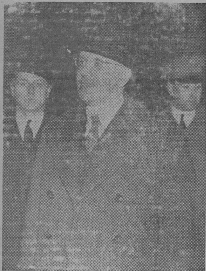
El Sr. Avenol secretario de la Liga de las Naciones saliendo de una de las conferencias que actualmente se están celebrando.

Después de que en forma estrepitosa, como sabe el lector, rompió el Canciller Hitler el Pacto de Locarno se ha acentuado cierta división, aun entonces embrionaria entre los que firmaron aquel.