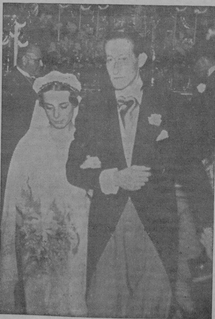
La señorita Cilly Aussen, tenista de fama mundial, de nacionalidad alemana, acaba de contraer matrimonio con el conde Murari, de nacionalidad italiana, natural de Verona.