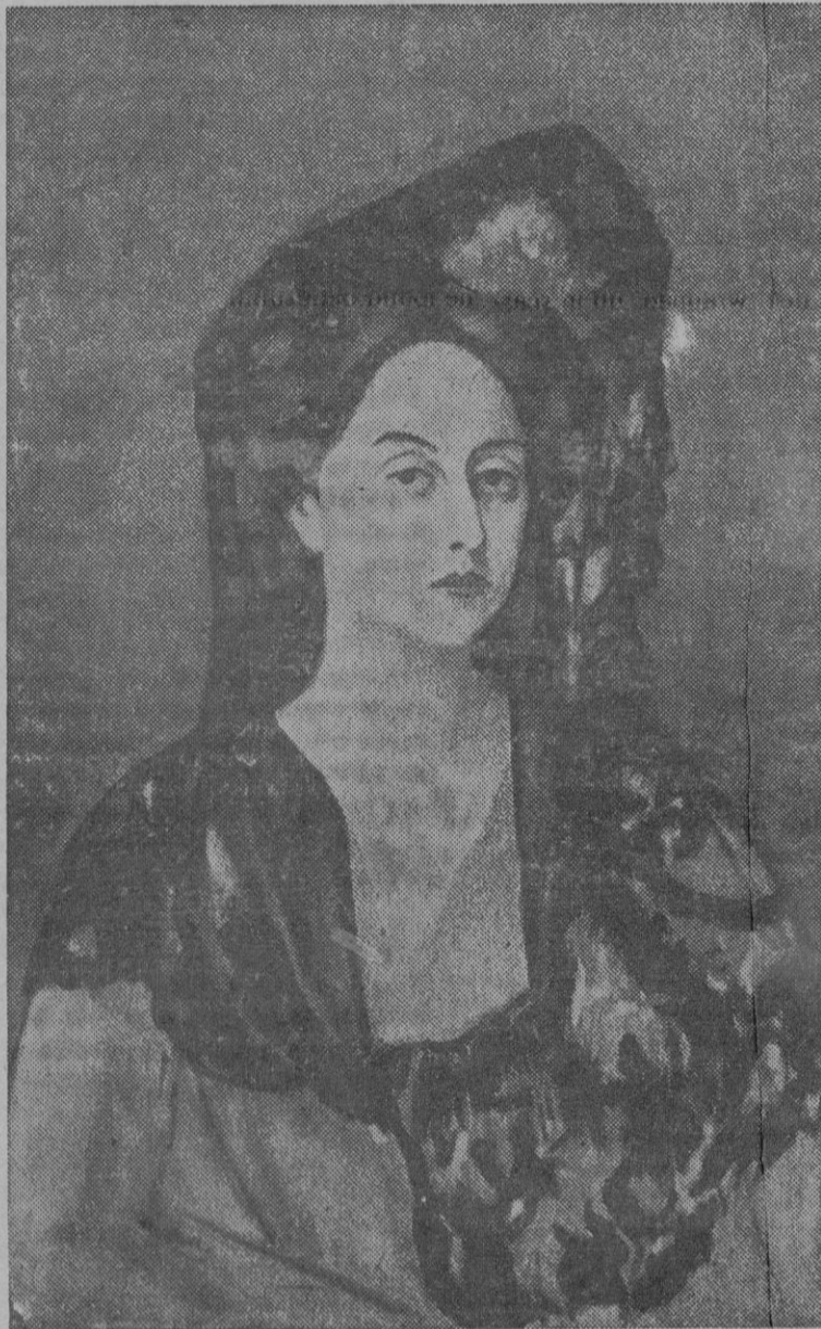
RETRATO DE LA SEÑORA CANALS (1906)

de Picasso fallan todas las teorías. Aparece en el arte tal como un gran pensador nuestro ha dicho de Goya: solitario, aislado,