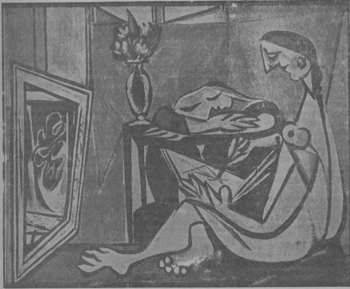
EL TALLER (1935)

creadora, que por su obra misma, con ser de excepción. En Picasso no hay lógica para explicarse influencias, ni aun siquiera preferencias. Es él en todo instante. Es él en cuando provoca los dítirambos y también cuando desata las más acerbas censuras.