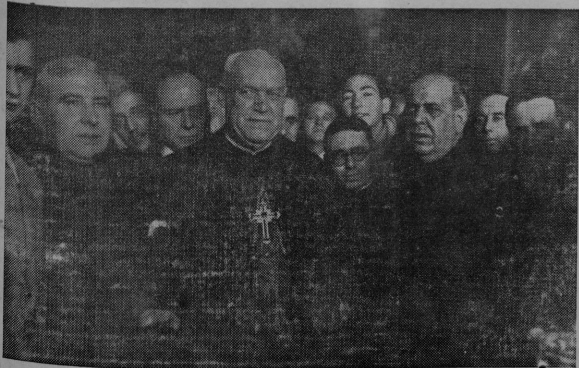
Llegada a Madrid del cardenal-arzobispo de Toledo Dr. Gomá

nación está muy claro; se necesita estar ciego para no darse cuenta de lo justísimo del manoseado ejemplo. Pero, hace algún tiempo, al tropezarnos con él, en el no menos manoseado Spengler, nos sublevamos contra la lógica de estas palabras. Muchas cosas son verdad hasta que dejan de serlo aclaradas por algún detalle, y en el famoso siml se oculta algo, al parecer sin importancia, que es la razón de ser de la Nave, de la tripulación y del capitán.