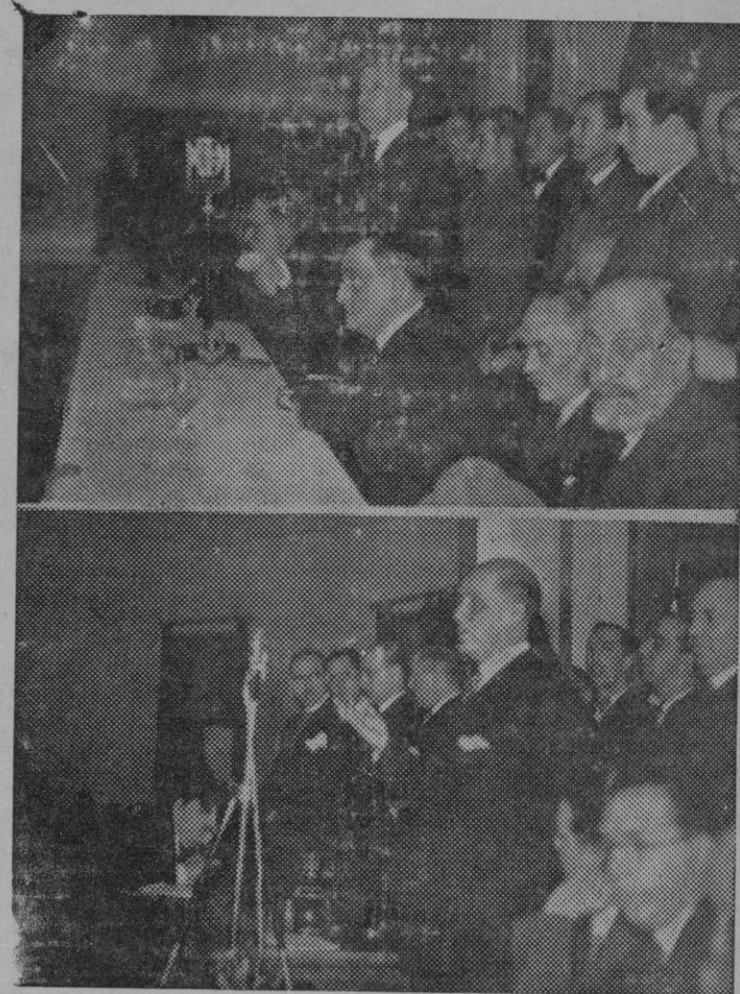
Don Victor Pradera, durante su discurso en el acto celebrado en Madrid. (Arriba).—El Jefe del Partido Nacional Sr. Calvo Sotelo durante su discurso en el Monumental Cinema de Madrid. (Abajo)