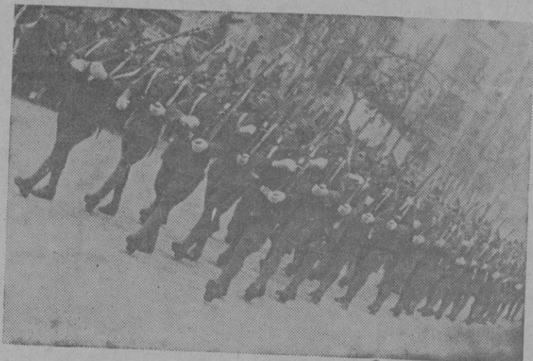
La infantería, al desfilarse grita ¡Viva la República!

En Cuba hay temporal de pasiones. Ansias de producir hundimien-