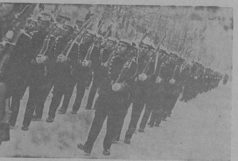
El desfile de los infantes de la Beneuéríta