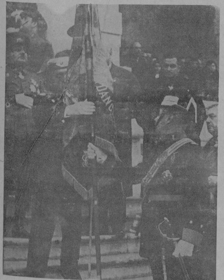
El abanderado recibe la bandera de manos del Jefe de la Comandancia