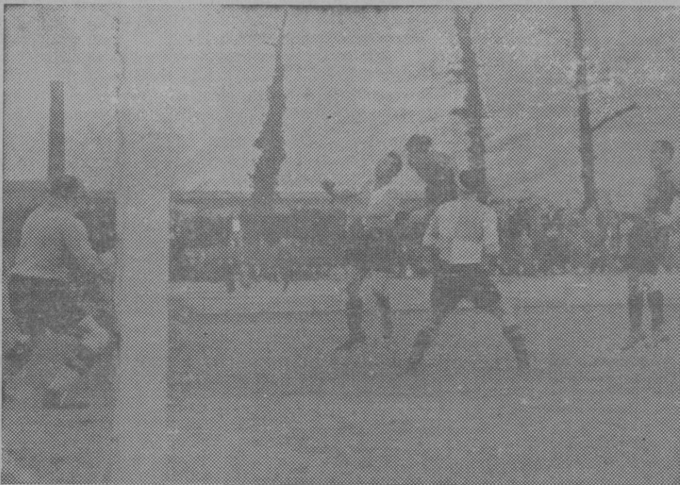
FUTBOL EN BILBAO.—En el campo de Ibaiondo de Bilbao, se ha celebrado el partido de fútbol entre los equipos Arenas de Bilbao y el Sabadell por no celebrarse el día 22 a consecuencia de un accidente de automóvil que sufrió el Sabadell. Numeroso público presenció el partido que dió un resultado de un empate 2 a 2