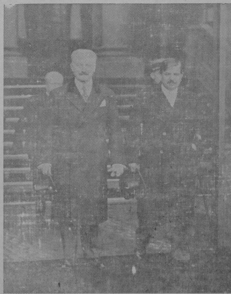
EL NUEVO AÑO EN PARIS.—El Sr. Lebrun, Presidente de la República francesa acompañado del Sr. Laval presidente del Consejo saliendo del Elyseo, para ir a devolver la visita a los Presidentes de las Cámaras.