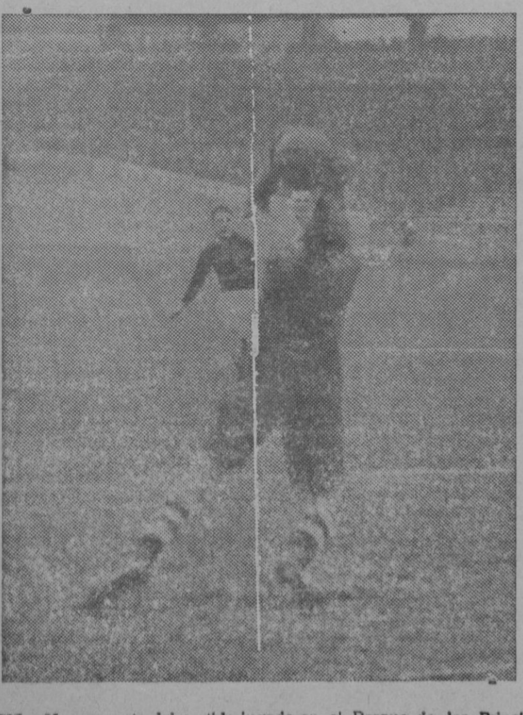
PARIS. — Un momento del partido jugado en el Parque de los Principes entre los equipos Racing-Club de Paris y una selección de Moscú, que terminó con el resultado de 2 a 1 a favor de los franceses

El cónsul egipcio en Addis Abeba ha confirmado los hechos referentes al bombardeo y como consecuencia de esta afirmación el patriarca copto y el comité egipcio