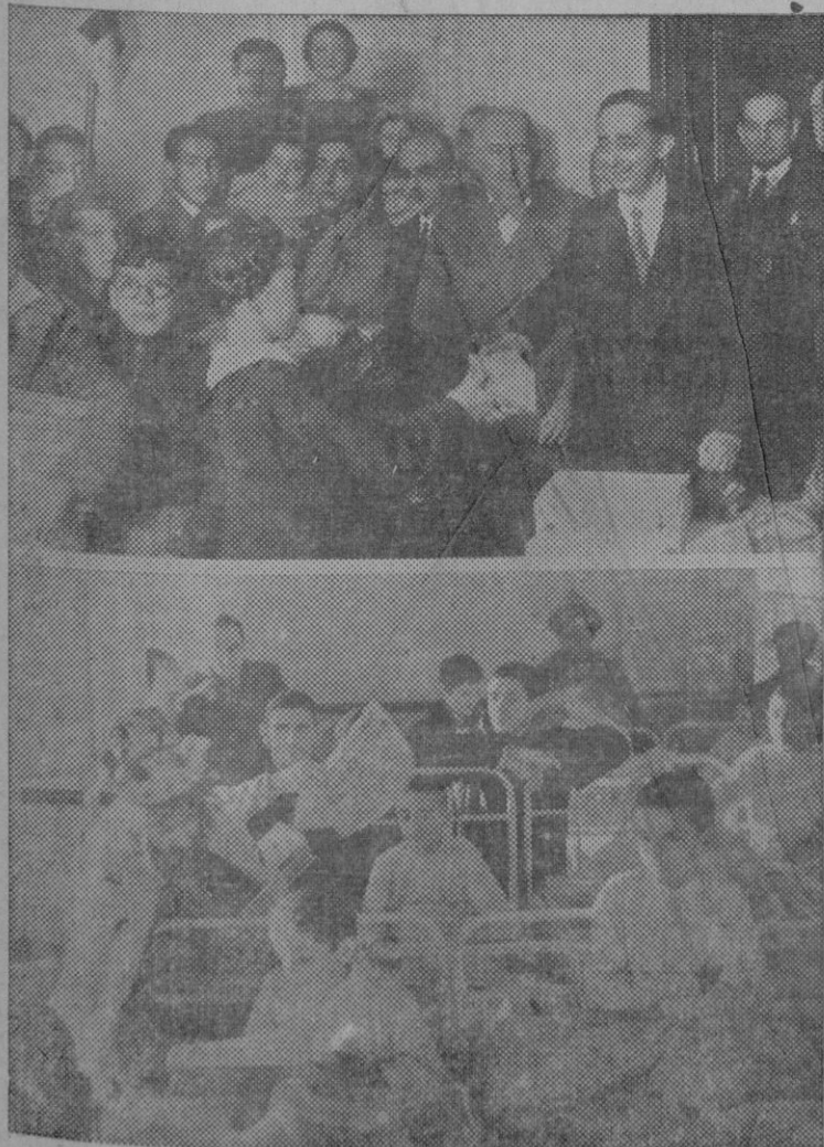
LA DIADA DE LOS REYES MAGOS EN MADRID.—Arriba: El embajador de los Estados Unidos repartiendo los juguetes que la sección juvenil de la Cruz Roja americana, envió a la sección juvenil de la Cruz Roja Española.

Abajo: Los reyes magos de la Compañía de Benavente repartiendo juguetes y periódicos infantiles a los inválidos del Asilo de San Rafael.