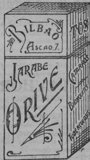
El mejor remedio para el peor catarro. JARABE ORIVE

El Pectoral y las Pastillas RICHELET se venden en todas las farmacias y droguerías. Las Pastillas se venden a 1,70 la caja, y caso de no encontrarlas, diríjase en seguida al Laboratorio RICHELET, San Bartolomé, 1. — SAN SEBASTIAN.