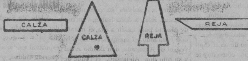
RECORTES Y PLETINAS PARA FABRICACIÓN DE HERRAJES