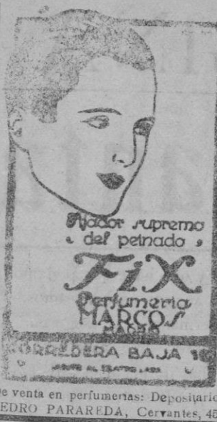
De venta en perfumerías: Depositario PEDRO PARARIDA, Cervantes, 45

Casa Central: Apartado de Correos. 12.020.-Madrid