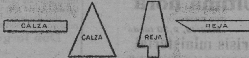
RECORTES Y PLETINAS PARA FABRICACIÓN DE HERRADURAS.