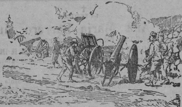
Una batería del 4.º ligero, librando combate para proteger el establecimiento de varias posiciones en la meseta de Iguermán

El fin artístico se logrará, haciendo comprender a los alumnos que la obra de arte es un maravilloso documento histórico, dotado mejor que otro cualquiera del poder de evocación; que el pasado es el presente de otras veces, a fin de que no vean los restos artísticos como cosa muerta, sino como algo dormido que no necesita para despertar más que un poco de simpatía. El valor social se advierte en ellas, porque el trabajo se realiza en colaboración; los niños se acostumbra al trato, se transmiten el entusiasmo por las cosas, todo es mundo, quitándole el carácter de cosa artificial y poco social que hoy día tiene la escuela, harán de la excursión escolar bien dirigida uno de los factores más esenciales de la educación.