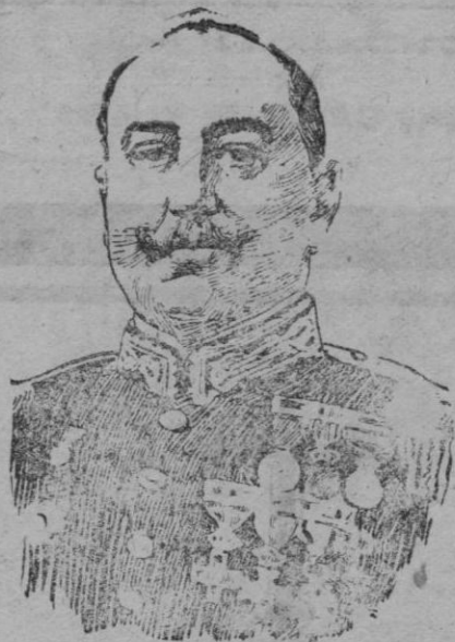
Don Francisco Aguilera, capitán general, que ha pasado a ocupar la presidencia del Consejo Supremo de Guerra y Maris, en la vacante por fallecimiento del marqués de Estella