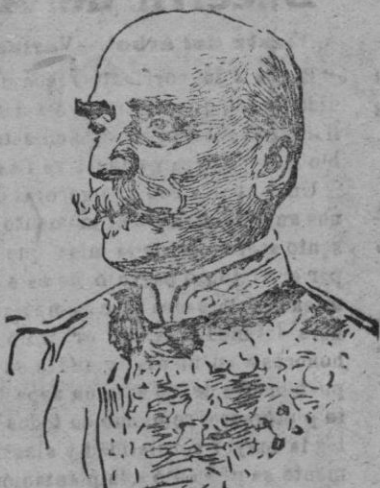
D. Fernando Primo de Rivera capitán general, que ha fallecido en Madrid.