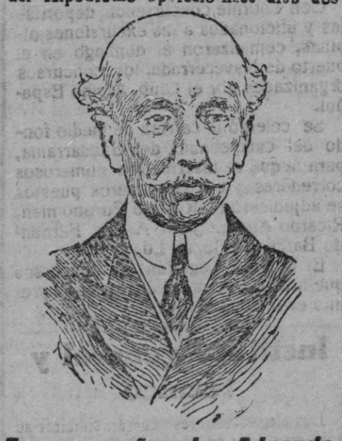
Excmo. señor don Eduardo Dato o tradler

El airoso volteo de las campanas, el estallido de los siseantes cohetes y los movimientos ondulatorios de la bandera roja y guarnición enarbolada en lo más alto de la torre, anunciaron ya de víspera el acontecimiento, y los coos de follaje, recubiertos de trepadora