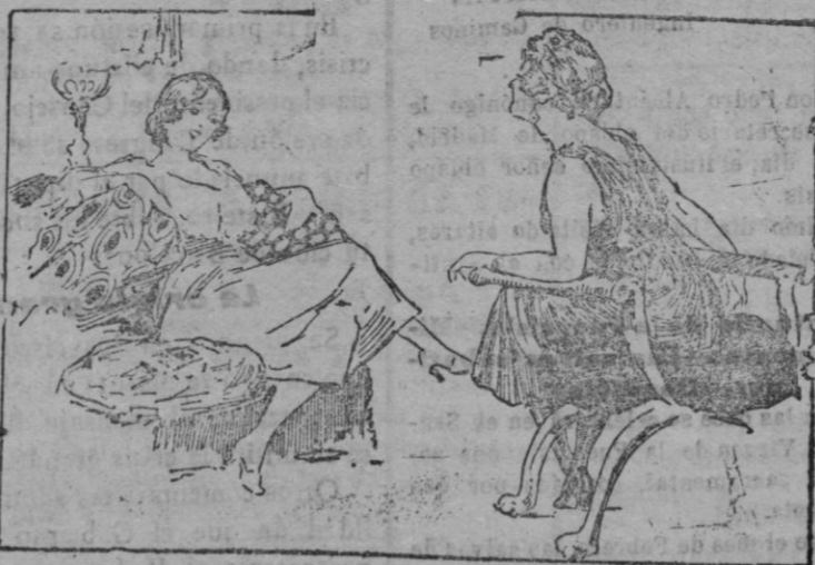
—¿Qué tipo de hombre te gusta más para marido? —El millonario.